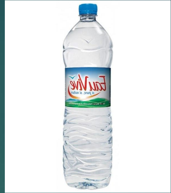
1 bouteille 1,5L