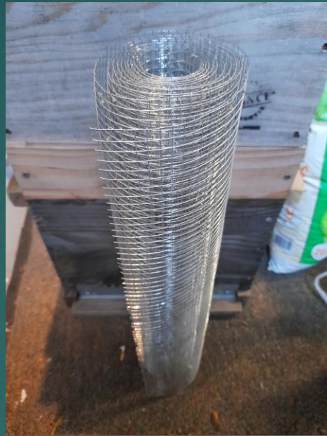
Grillage maille 6x6