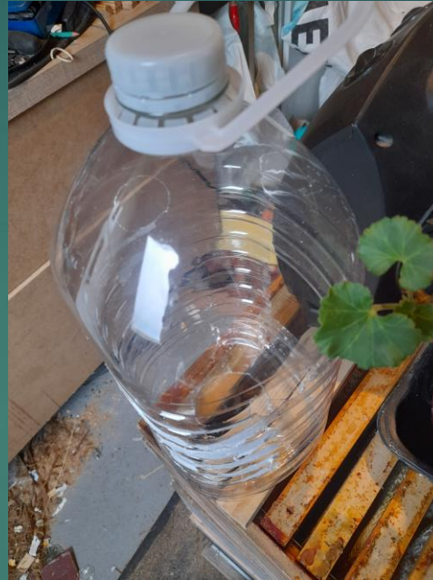
2 Bouteilles 5L