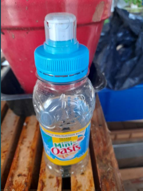
2 bouteilles de jus de fruit